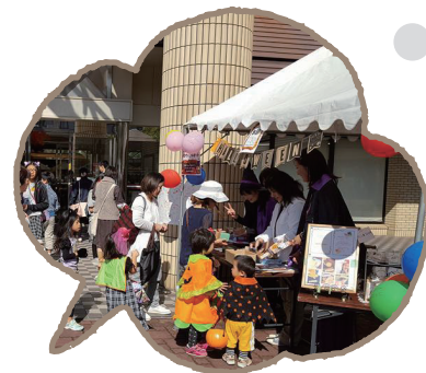
はじめての出店も ウェルカム!