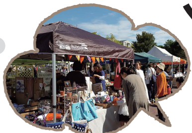
ここちあんなって こんなマルシェです。